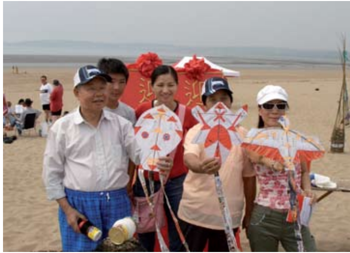
Chwith: Rhwydwaith Amgylcheddol Ddu (RAD)